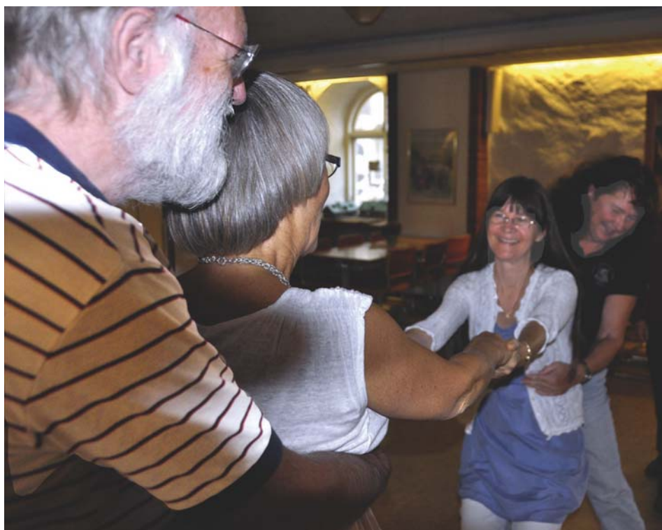
Dragkamp avsutade "Bro Bro Breja".