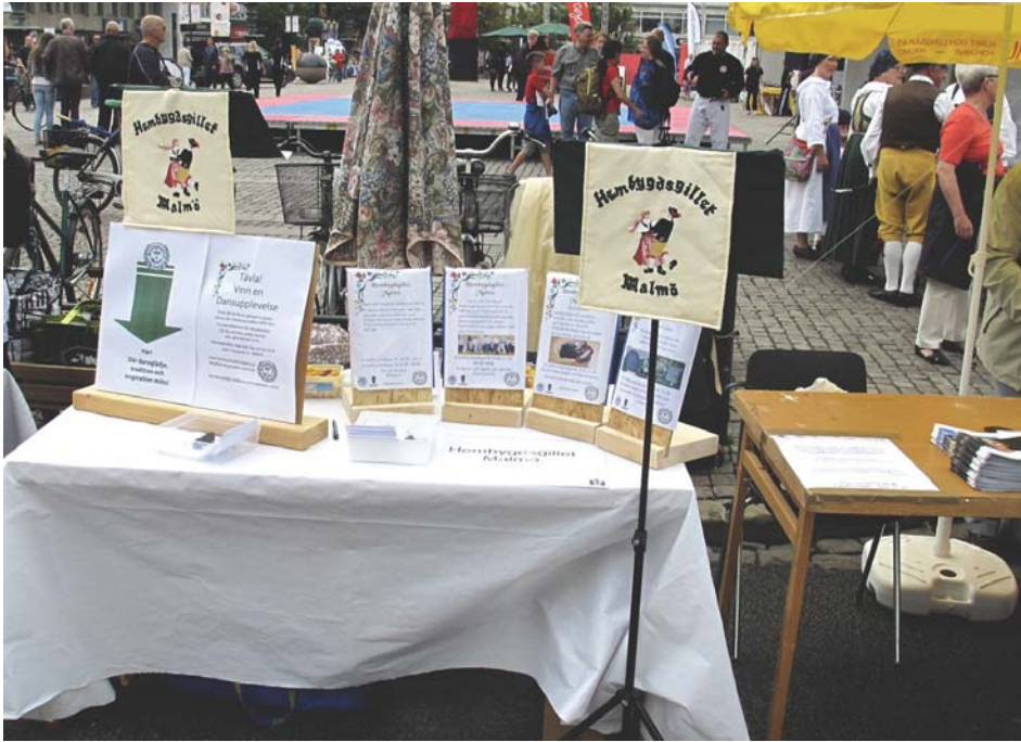
Hembygdsgillet information som var lätt att plocka på sig.

Malmöfestivalen är välkänd sedan flera decennier, men alla känner kanske inte till Föreningarnas dag som har lika lång tradition som festivalen. På söndagen under festivalen har föreningarna i Malmö möjlighet att presentera sig och sin verksamhet både praktiskt och mer teoretiskt.