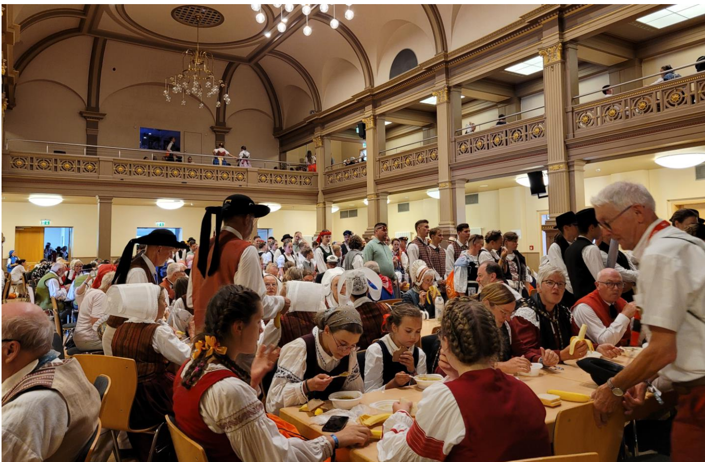
Stadthalle där deltagarna åt sina måltider. Foto, Margareta Nilsson

Från Sverige deltog Dalalaget, Folkdansgillet Kedjan från Stockholm, Malmö folkdansare och vi från Linderöds folkdanslag. Vi åkte buss med Malmölaget och bodde även tillsammans med en del av dem, mycket trevligt. Ju närmare Gotha vi kom, desto vackrare blev landskapet. Gotha omges av enormt stora odlade fält och när vi kom stod säden gyllengul. Vägen gick genom små samhällen med hus i korsvirkesstil eller med väggbeklädnad av skifferplattor i olika mönster.