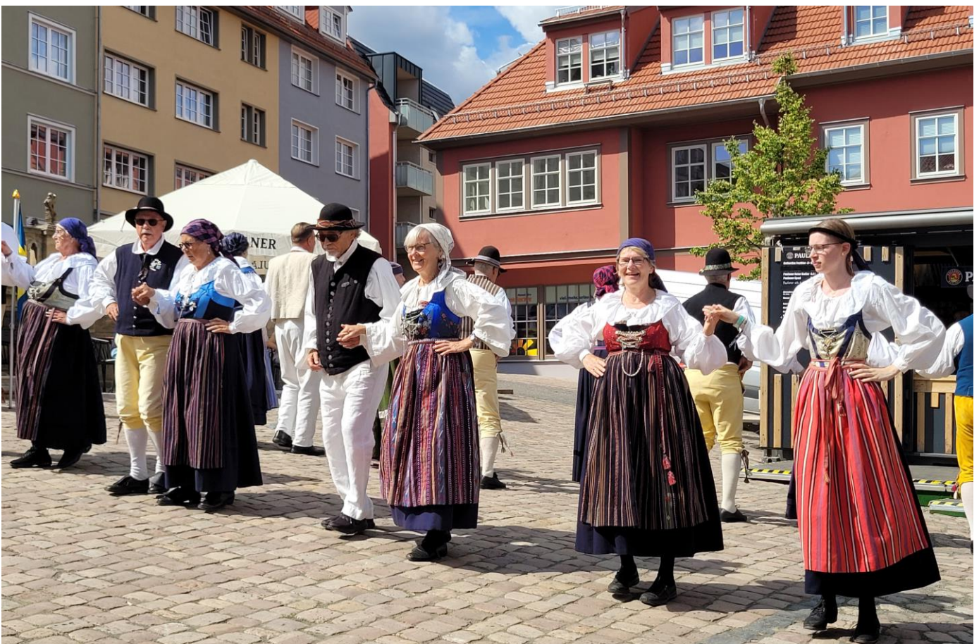
Malmö Folkdansare dansar uppvisning på det lutande torget.

Den stora invigningen sker alltid på torsdagskvällen. I Gotha var det samling på Arenan. Europeadens orange flagga hissades, det var tal och musik, men framför allt framträdande av cirka hälften av de deltagande grupperna. Vi satt på läktarna och förundrades än en gång över mångfalden och all den tid och ansträngning som deltagarna lagt ner för att kunna presentera sina traditioner.