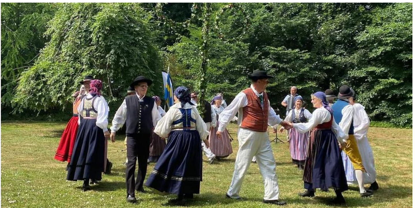
En midsommarbild från Malmö Folkdansare