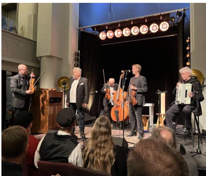
Foto från middagen och dansen

Som sagt så är det vi som håller i stämman nästa år, vi slipper problemen med resorna men i gengäld har vi en massa att förbereda och ordna. Har du några idéer om vad vi kan bjuda gästerna på, både vad gäller aktiviteter och mad får du gärna höra av dig. Vill du dessutom vara med som funktionär och träffa trevliga dansare från hela Sverige är du mer än välkommen!