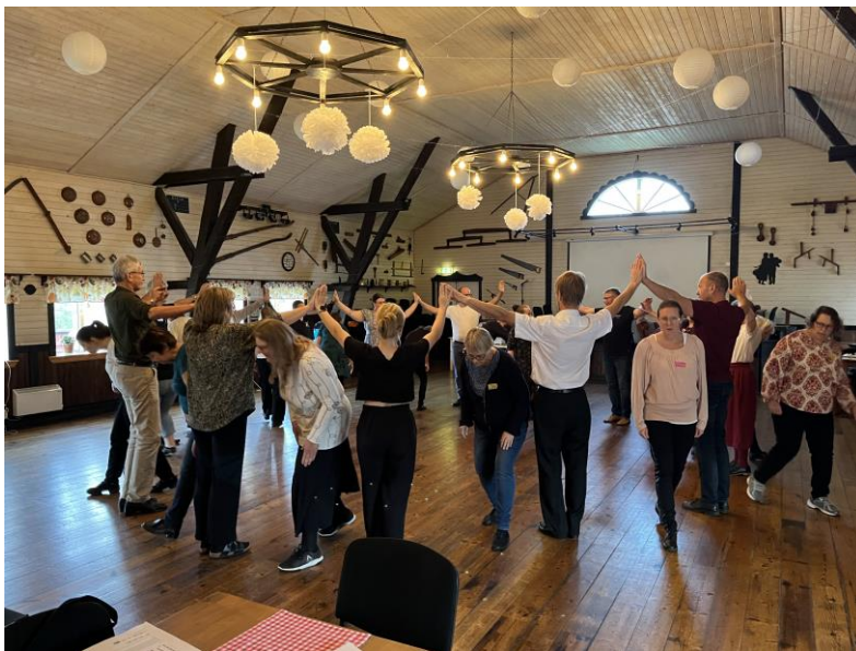
Bild från Riks dansledarutbildning som hölls på logen i Lund.