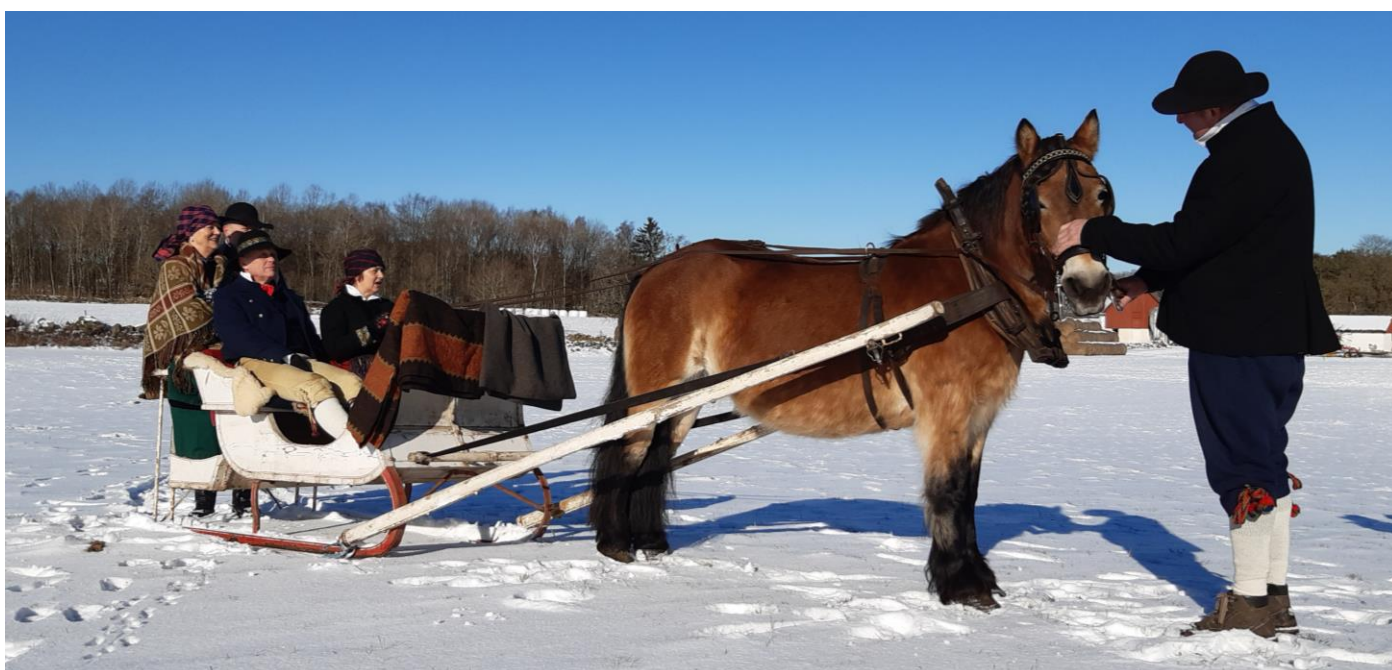
Hästen Tekla med släde i härligt vinterväder.