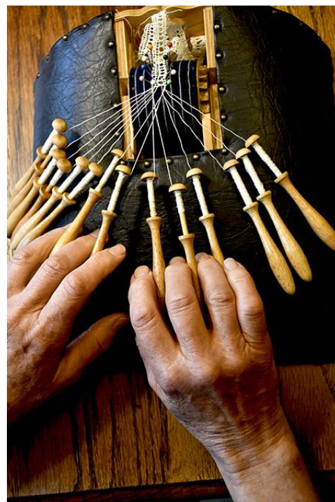
Foto på knyppeldyndan