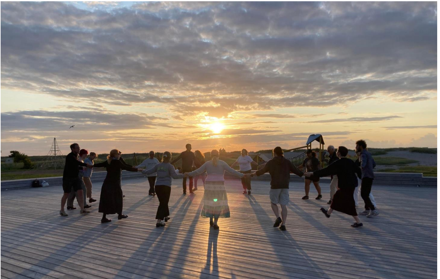
Dans på Ribban!