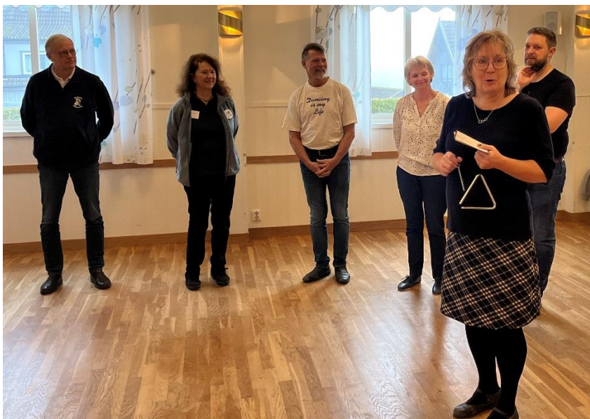
Dansledardagen