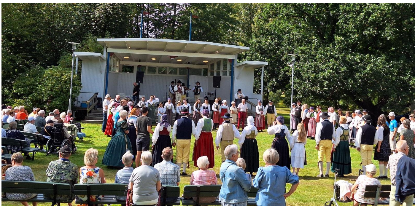
En rejält stor Kadrilj från förra årets Skånedag.