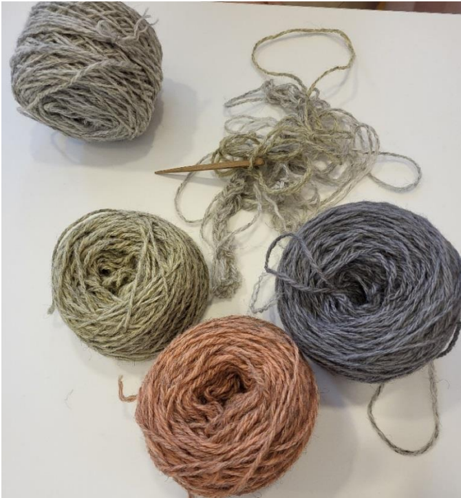
Utgångsmaterial, ullgarn och nål.